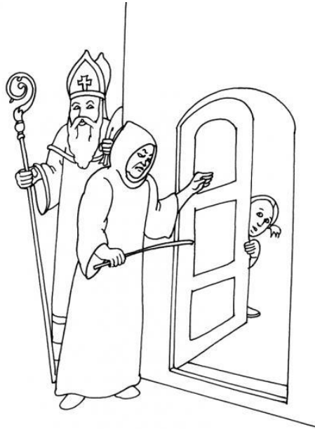
Saint Nicolas et le Père Fouettard