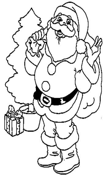
le Père Noël