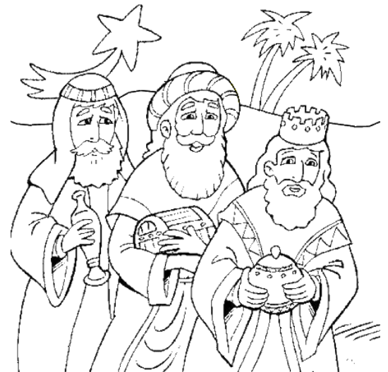
les Rois Mages