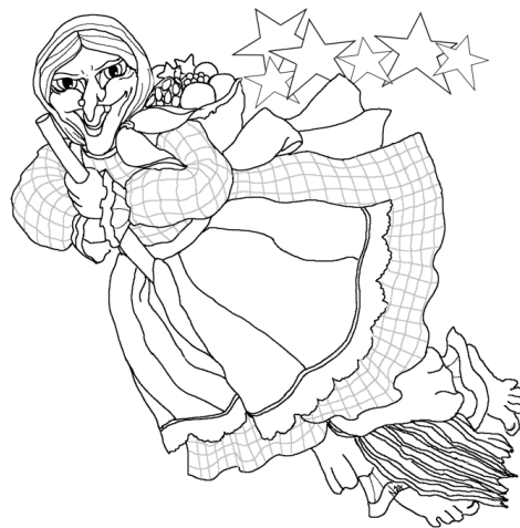
la sorcière Befana